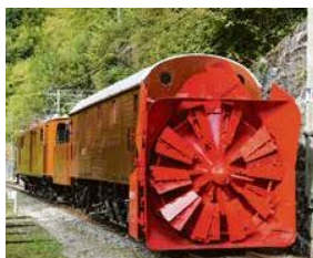
Convoi historique Bernina sillonne le magnifique décor de la Riviera vaudoise.