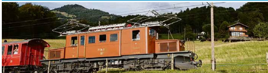
La mythique Crocodile de la Bernina venue tout spécialement depuis les Grisons.