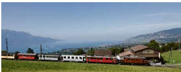
Démonstration du fonctionnement du chasse-neige rotatif à vapeur. Il n'en reste que 2 exemplaires de ce type en Europe.