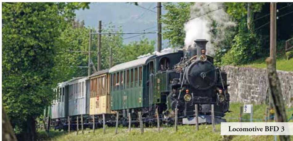
Locomotive BFD 3

Comme c'est le cas depuis plus de 35 ans, les amateurs de nostalgie ferroviaire pourront s'en mettre plein les yeux. Le Blonay-Chamby sortira ainsi de sa collection quatre locomotives à vapeur (mises en circulation entre 1890 et 1918!), dont la BFD 3, datant de 1913 et qui fut opérationnelle sur la ligne Brigue-Furka-Disentis jusque dans les années '40. Elle sera remise sur les rails lors de ce festival, après deux ans de révision approfondie dans les ateliers de Chaulin. Durant les trois jours, des trains circuleront au départ de Vevey et de Blonay, majoritairement en traction vapeur. Points forts : un train en triple traction, le samedi en fin de matinée, des trains à vapeur au départ de Vevey, le dimanche et le lundi matin.