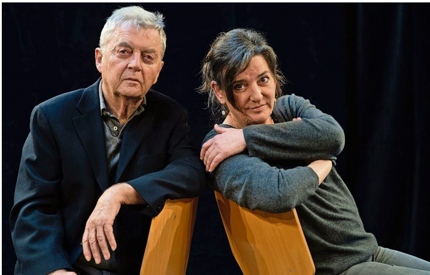
Le duo de «Bergamote», à voir à Yverdon. ALAIN WICHT