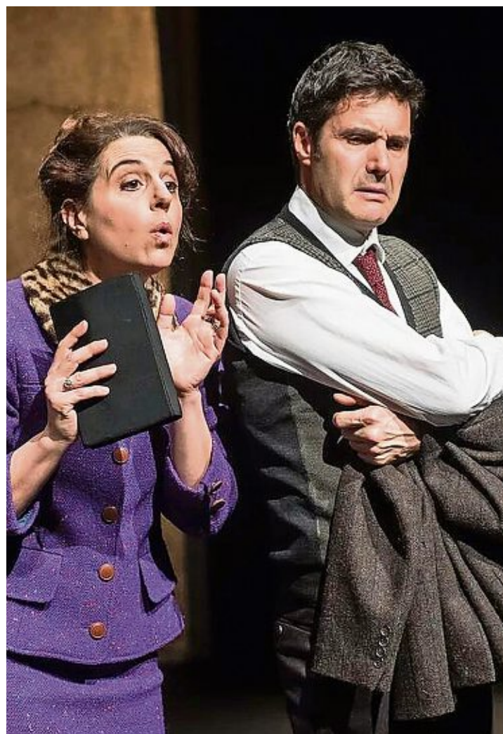
«Théâtre sans animaux», pièce jouée à Gland.

Lausanne – Lamalera, en Indonésie. C'est sur cette île qui abrite l'un des derniers villages au monde où la population vit de la pêche des baleines, que sera conduit le public de l'Arsenic en fin de semaine. «Ocean Cage» du réalisateur Tianzhuo Chen et du chorégraphe Siko Setyanto combine vidéo, danse, performance et musique pour inviter spectatrices et spectateurs à la rencontre de cette culture empreinte de rites. Sur scène, Siko Setyanto est accompagné à la musique de deux artistes d'Indonésie également, Kadapat et Nova Ruth. (LGL) Arsenic, ve 17 et sa 18 (20h), di 19 (17h). www.arsenic.ch