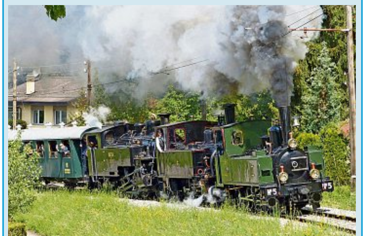
Le Blonay-Chamby

Place Bellerive, jusqu'au di 2 juin. Infos et horaires détaillés: www.lausanne.ch ou www.facebook.com/LunaPark.Lausanne